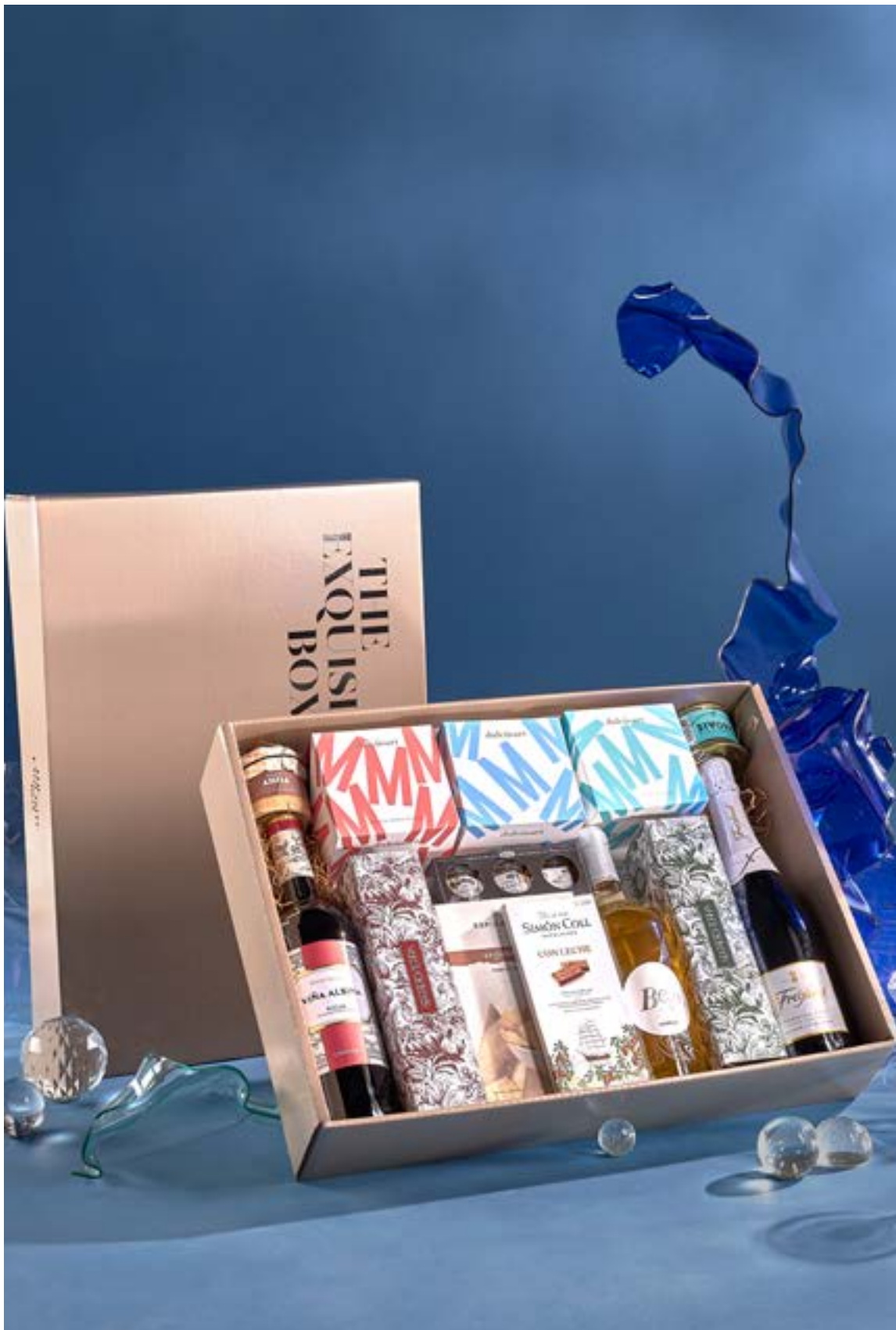
LOTE THE EXQUISITE BOX 320 REF. 4D2CTEB320 · 46,92€ 53,33€ IVA INC.